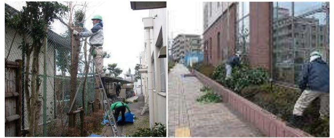
▲福祉センターの植木剪定 ▲振興プラザの植込み剪定

地域社会に貢献することも当SCの活動目的の一つです。植木グループの皆さん、お疲れさまでした。