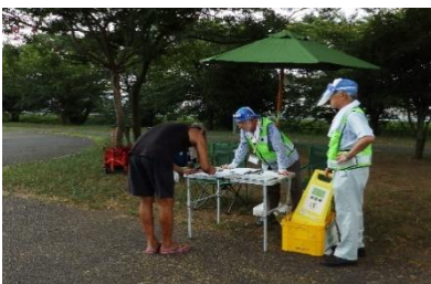
(バーベキュー受付)

フォームを取材した写真をご紹介します。再開された事業では、いずれもコロナ感染を防止するため出来る限りの対策を取って臨んでいます。